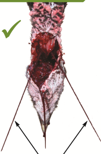
Patiwarik na hugis-V porma ng pagtagas ng dugo ugat